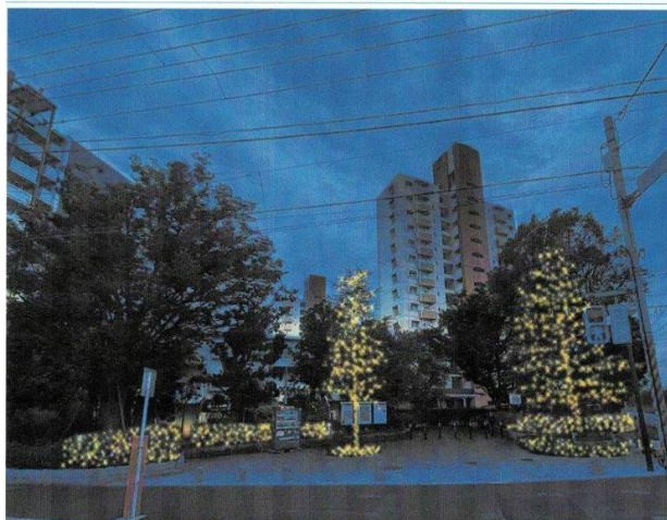
塩浜団地イルミネーション設置イメージ

ソーラー発電の電飾で限界も有りますので、対応策を協議の結果、団地入口だけ、通常の電気を使用したイルミネーションに変更する方向で調整しています。設置費用等は自治会予算で実施することで管理組合の許可も頂く予定です。